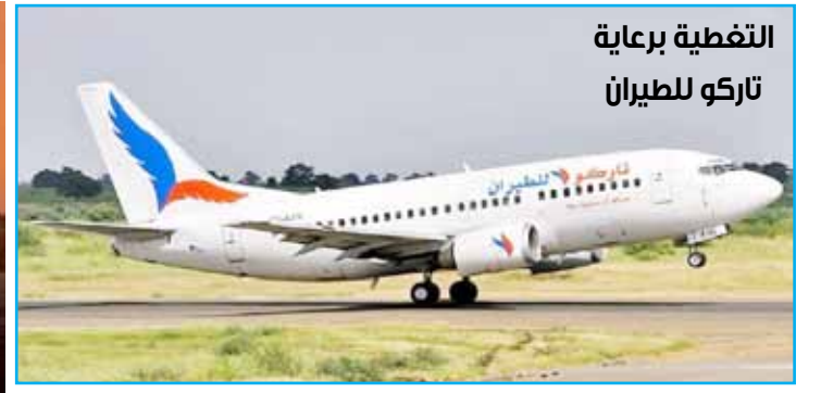
التغطية برعاية تاركو للطيران