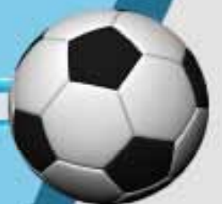
رمضان أحمد السيد